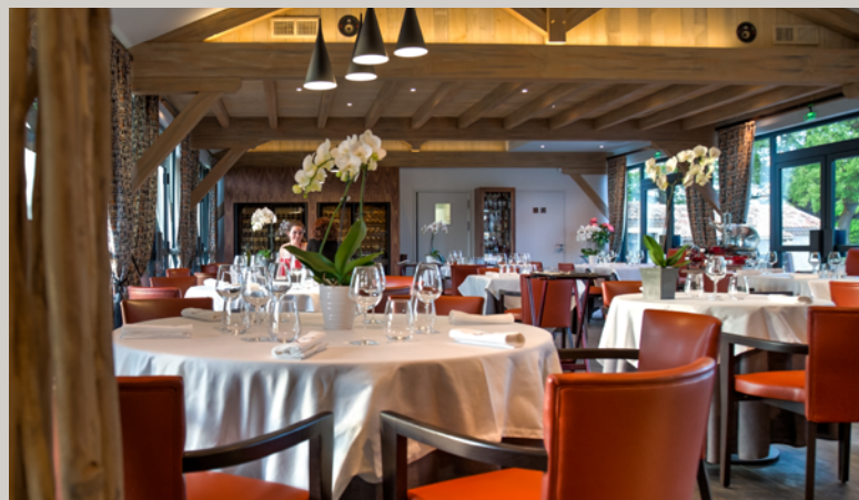
Le restaurant gourmand, Nazère la Table.