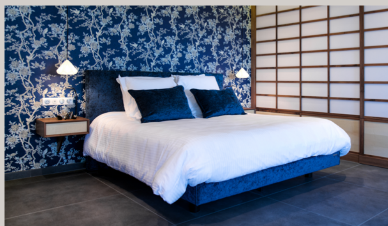
5 Suites de luxe, spacieuses et lumineuses.

Ce lieu de réunion est à tout moment une invitation au voyage : un parc de 6 hectares, des suites élégantes, une salle de séminaire, piscine, tennis... la quiétude et la beauté des lieux ne peuvent qu'apporter un succès garanti à vos formations et séminaires.