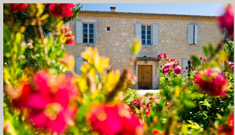
Le gîte, d'une capacité d'accueil de 8 personnes.