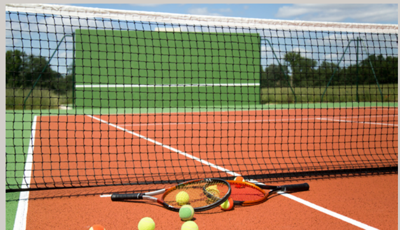
Tennis, basket, putting green et boudrome.

Contactez-nous pour établir votre devis incluant :